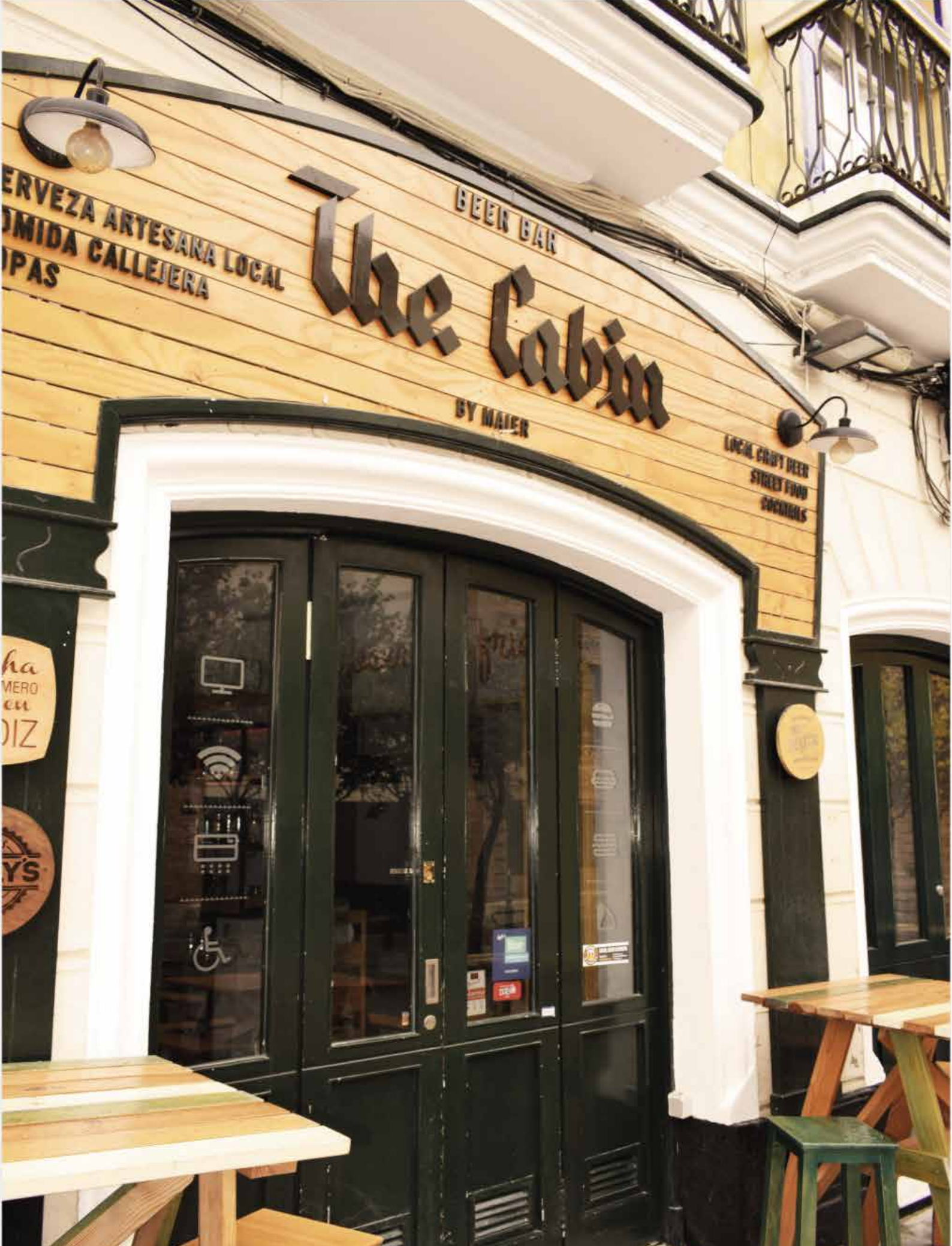
The Cabin Beer Bar